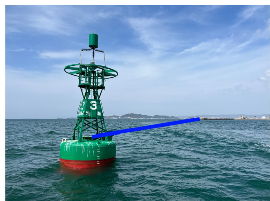
フィニッシュライン想定図

フィニッシュラインの北端は、マリーナシティ防波堤南端灯台から270°に伸ばしたラインを北端とします。