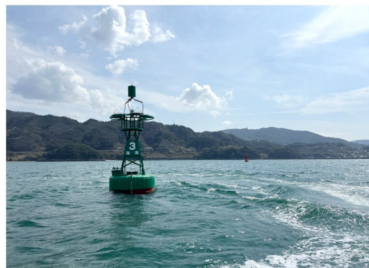
緑色に「3海南」の表記が目印です

フィニッシュラインの北端は、マリーナシティ防波堤南端灯台から270°に伸ばしたラインを北端とします。